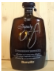
Brandy OF Stravecchio Barrique "Bonollo" €39.00

liquore a base di infuso d'erbe con grappa OF amarone barrique 30% vol [Product Details...]