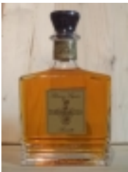
Amaretto di Mombaruzzo "Berta" €28.00

distillato di vino invecchiata in legni diversi per 20 anni 44% vol [Product Details...]