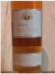
Acquae Vitae Acquavite di Vino 25 anni "Berta" box I €60.00

distillato di vino invecchiata in legni diversi per 20 anni 44% vol [Product Details...]