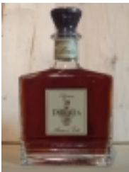
Amaro d'Erbe DiBerta "Berta" €28.00

liquore a base di mandorle 28% vol [Product Details...]