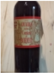
Amaro della Contea di Bormio "Carlo Ericini" Bormio €18.00

infuso di erbe, senza coloranti e conservanti 28% vol 50cl [Product Details...]