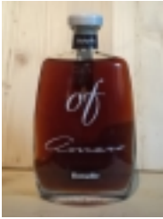
Amaro OF "Bonollo" €25.00

infuso di erbe, senza coloranti e conservanti 28% vol 50cl [Product Details...]