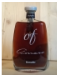
Amaro OF "Bonollo" €25.00

infuso di erbe, senza coloranti e conservanti 28% vol 50cl [Product Details...]