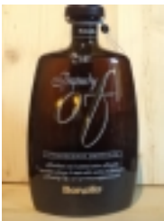
Brandy OF Stravecchio Barrique "Bonollo" €39.00

liquore a base di infuso d'erbe con grappa OF amarone barrique 30% vol [Product Details...]