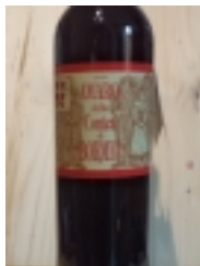
Amaro della Contea di Bormio "Carlo Ericini" Bormio €18.00

infuso di erbe, senza coloranti e conservanti 28% vol 50cl [Product Details...]